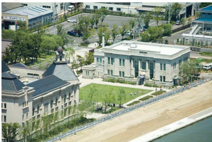
外観（空撮）右手の建物が旧第四銀行住吉町支店

また、みなとぴあ敷地内には、望楼とアーチの門が特徴的な擬洋風の旧新潟税関庁舎(国指定重要文化財)や、かつて市を代表する西洋建築のひとつであった二代目新潟市庁舎の外観を模した博物館本館等が建ち、浪漫溢れるエキゾチックな景観が楽しめます。