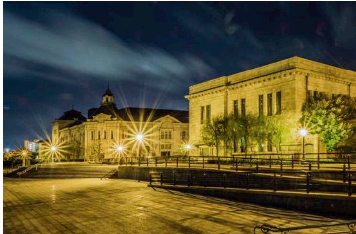
外観（夜景）右手の建物が旧第四銀行住吉町支店