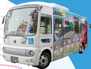
「마치고토 미술관cotooto」가 그려진 차량