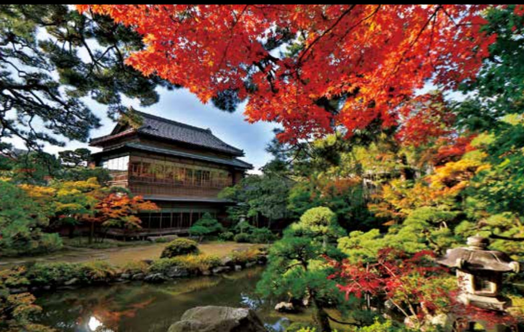
舊齋藤家別邸 建造年數達200年的豪商齋藤家的別墅，迴游式庭園以及近代 日式風格的建築值得觀賞，可以重溫新潟商人繁榮時代。 #theniigatasaitovilla #japanesegarden #niigatalove