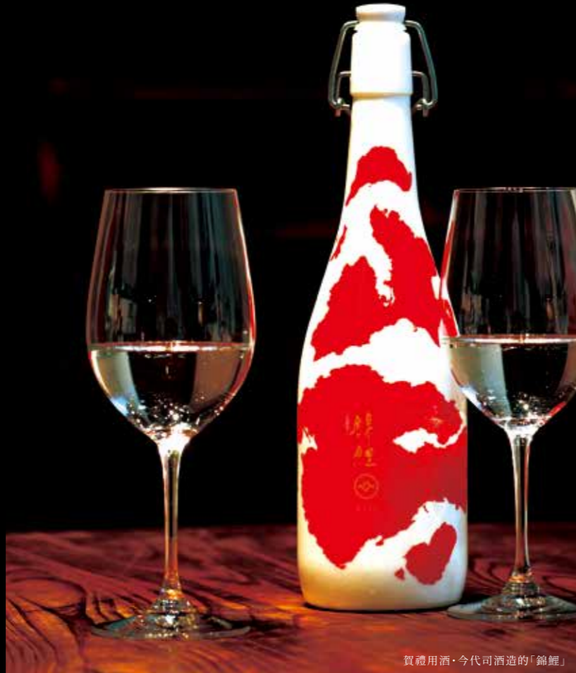
賀禮用酒・今代可酒造的「錦鯉」

葡萄酒 匯聚了5家葡萄酒廠的新潟葡萄酒海岸線,酒廠釀製著各具特色的葡萄酒。 #wine #niigatawinecoast #niigatalove