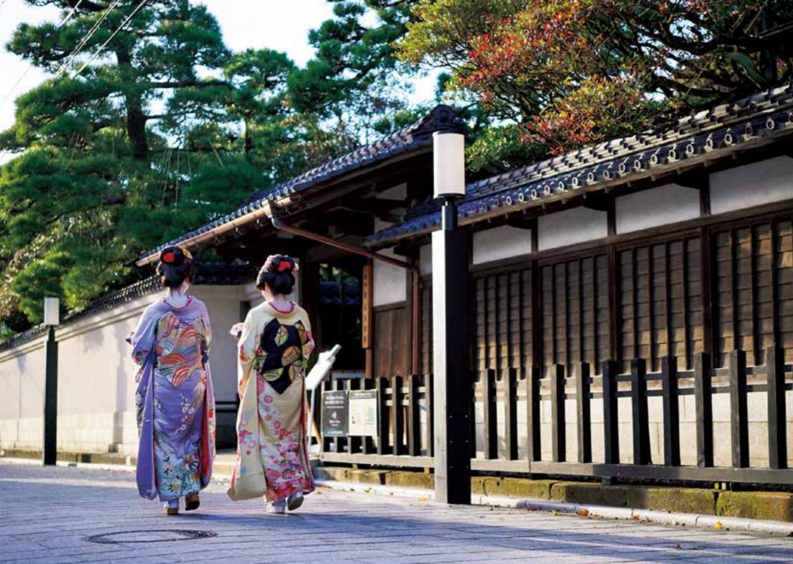
新潟古町藝妓 新潟古町的花街，有著引以為豪的200年的悠久傳統。 這裡以精妙華麗的技藝，傳達新潟的待客文化。 #furumachigeigi #furumachi #niigatalove