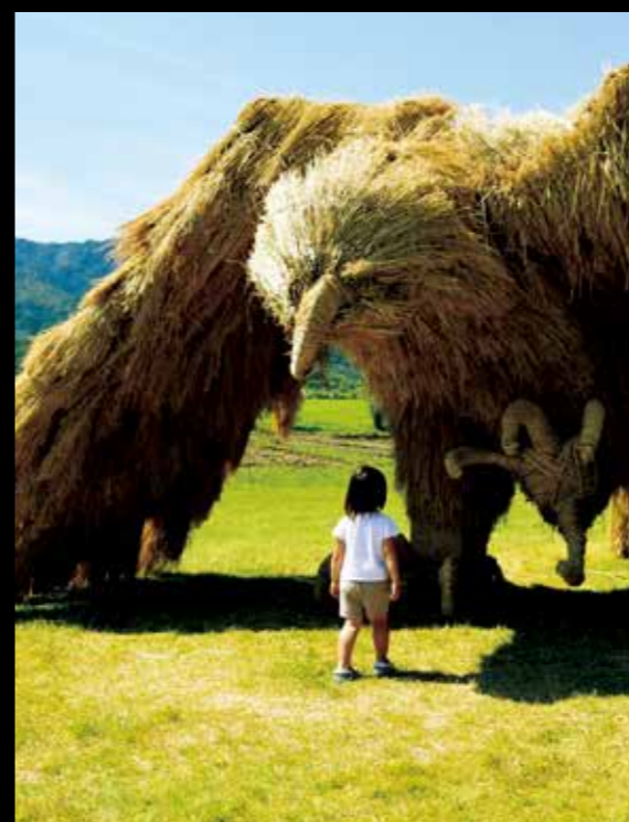
稻草藝術 稻米產地新潟，擁有把稻草加工成為生活用具的生活智慧。如今，巨大的稻草藝術作品點綴著新潟的秋天。 #waraart #uwasekigata #niigatalove