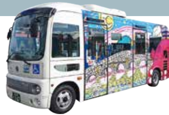
作家/Shunsukei 標題/劇場版 絕望!!!十月章魚怪侵襲萬代橋

[票價] 乘車1次 大人210日幣 兒童110日幣 1日乘車券 大人500日幣 兒童250日幣