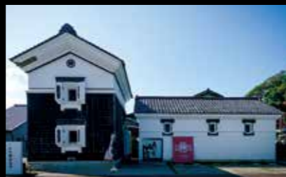
峰村釀造 有著創業110年以上歷史的味噌倉庫。可以參觀工廠，還設有可以買到味噌和醬菜等的店鋪、咖啡館。 #niigatamiso #nuttari #minemurajozo