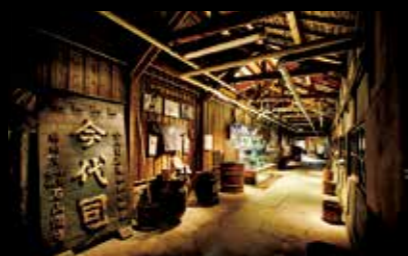
今代司酒造 約250年前創業的老字號酒窖。可以參觀酒窖和試飲，還可以購買產品。 #niigatasake #nuttari #imayotsukasa