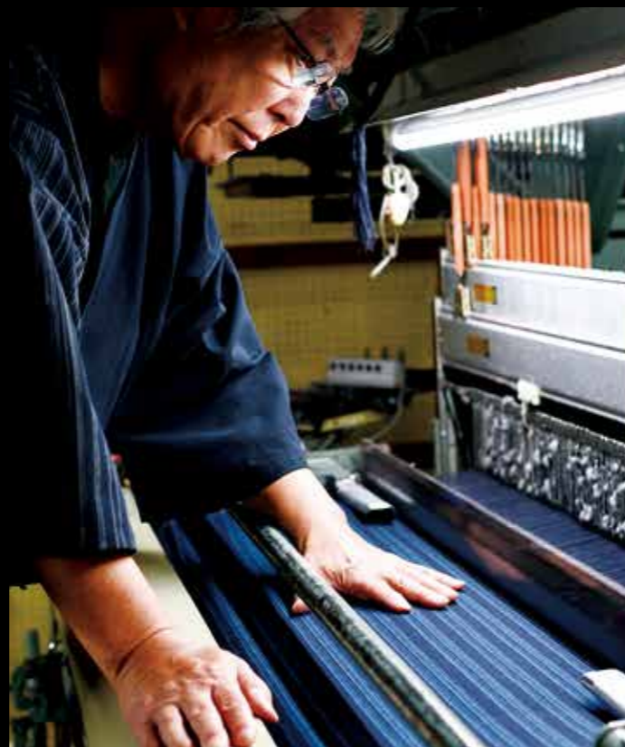
龜田縞 作為務農服裝的布料而誕生的紡織品。傳統顏色的條紋花樣、結實柔軟的手感是其特徵。 #kamedajima #niigatafabric #niigatalove