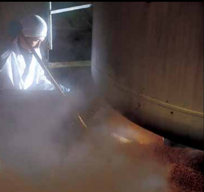
味噌倉庫 船載的鹽和大豆邂逅了新潟稻米，從此便作為新潟的發酵文化紮根和發展起來。 #niigatamiso #niigatalove