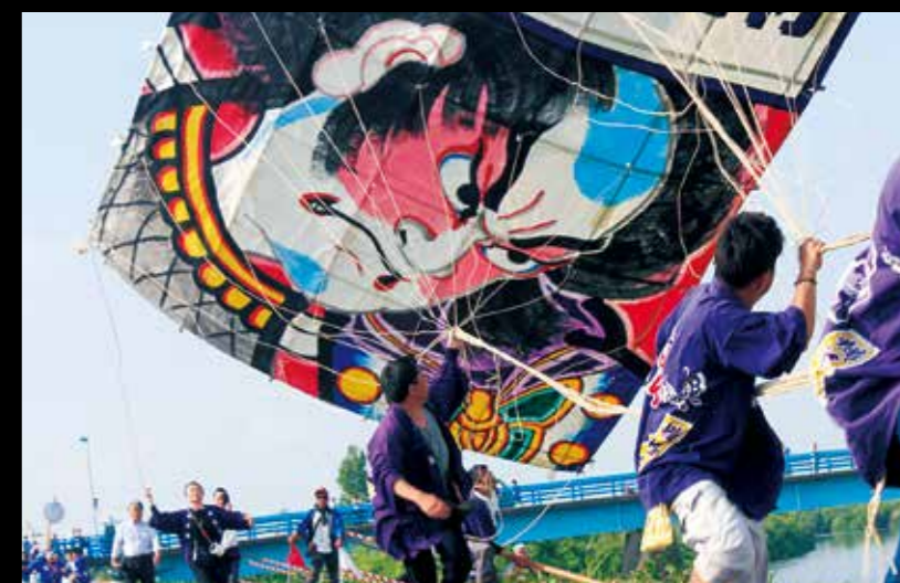
白根大風箏對戰 精心製作的風箏在空中互相纏繞，是個生氣勃勃的節日。畫著鮮艷圖案的巨大風箏在天空飛舞的景象極為壯觀。 #shirone #shironetako #niigatalove