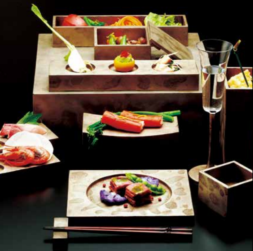
新潟漆器 被稱為「變塗」寶庫的新潟漆器。其濃郁創新的風格，用來做餐具獨具魅力。 #niigatashikki #japaneselacquerware #niigatalove

因貿易而繁榮的港口城市新潟，各地多種技術交流傳播，綻放了新潟獨特的文化之花。傳統技藝如今仍在不斷發展。