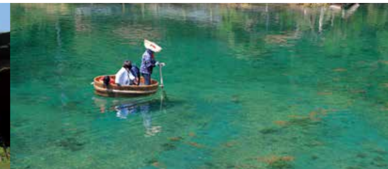
Тараибунэ (лодка в виде деревянного таза)

Это исторический памятник, который повествует о 400-летней истории горы Кингиндзан Садо . Он богат множеством экскурсионных объектов таких, как обзорная экскурсия по вырытым вручную тоннелям, бывшие места горной добычи, плавильные цеха, цеха для извлечения необходимого металла и другие производственные места.