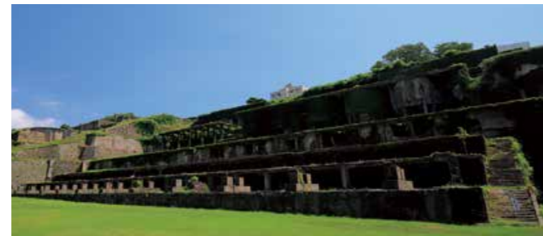
Гора Кингиндзан Садо (рудник по добыче золота и серебра)

Это одаренный историческим наследием и прекрасной природой остров, на котором до сих пор живы древние традиции. Здесь можно испытать на себе традиции, провести экскурсии и заняться другой активной деятельностью.