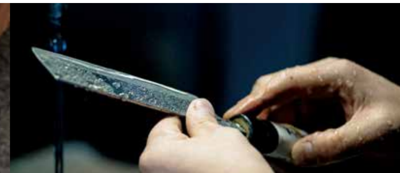
Мастерская по производству ножей Тадафуса

Гёкусэндо - это старинная мастерская Цуки доки , основанная 200 лет назад и практикующая традиционную технологию изготовления посуды путём отбивания молотком одного медного листа. Можно осмотреть мастерскую и старинные здания, имеющие статус материального культурного наследия.