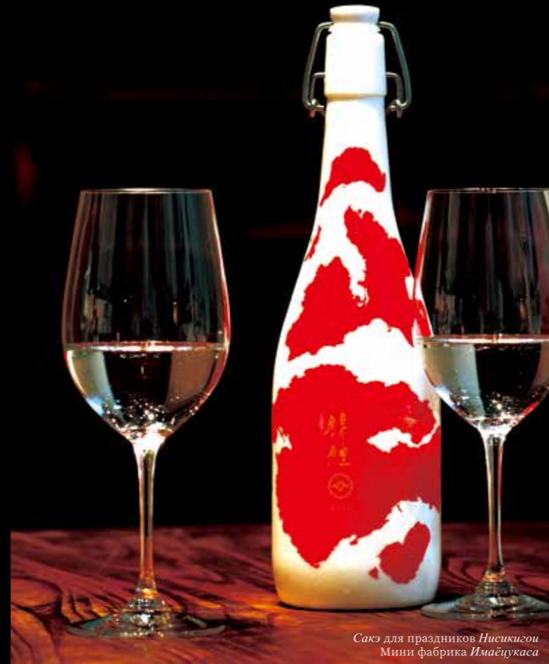
Саке для праздников Нисикигои Мини фабрика Имайцукаса