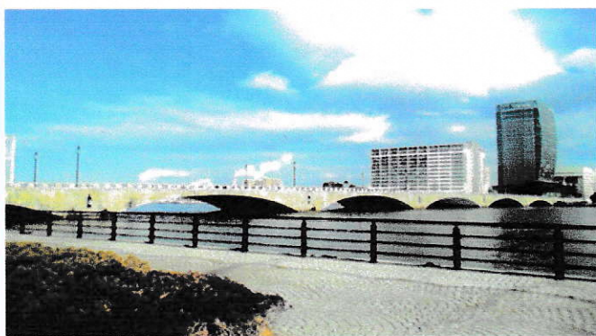
新潟市のシンボル信濃川と萬代橋