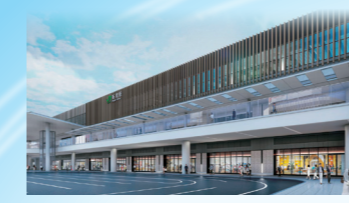
※2027年 春 全体開業予定 新潟駅 完成予想図